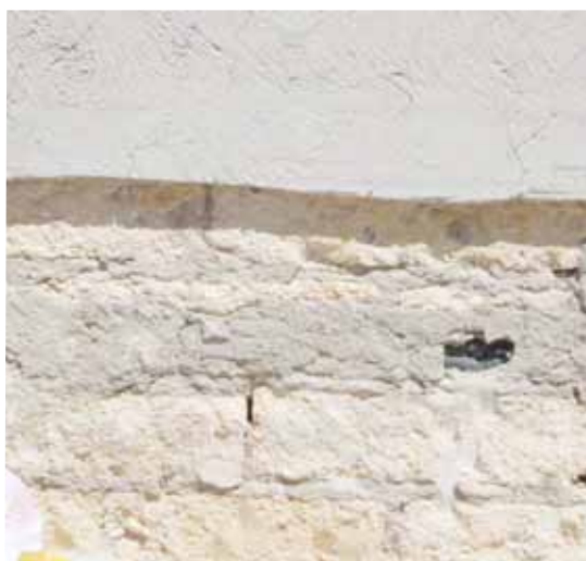
Supporto spicconato e pulito