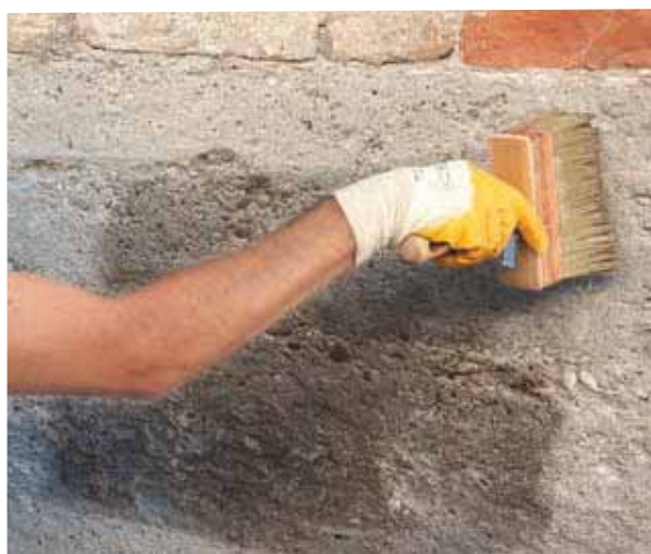
Applicazione antisalino IDROSAL WET