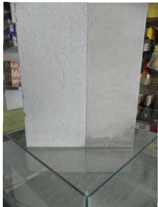
Un esempio di come si comporta l'intonaco deumidificante WET immerso nell'acqua