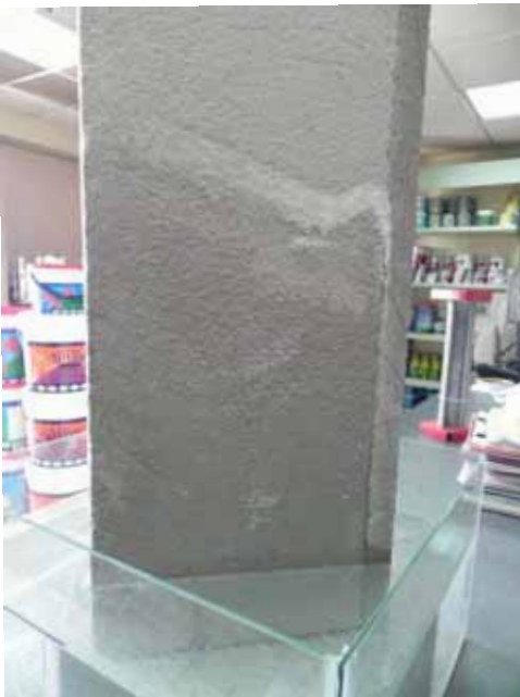
Un esempio di come si comporta un intonaco tradizionale immerso nell'acqua

In pratica Kunzel ha espresso in termini matematici il concetto fondamentale che l'acqua in un'opera muraria non deve entrare, e se vi entra deve poter uscire. Concetto che si può senz'altro sottoscrivere in base anche al buon senso e all'esperienza.