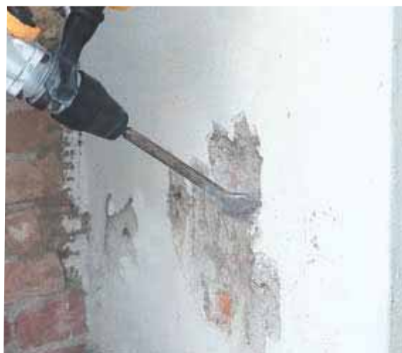
Rimozione dell'intonaco degradato